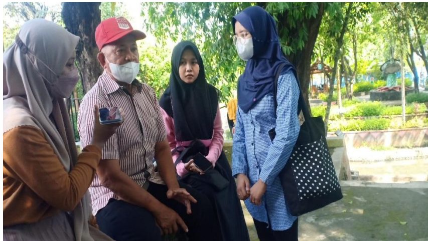
Gambar 1 2 Foto Penyusun Saat Melakukan Wawancara Kepada Juru Kunci Sumber Keduk Beji