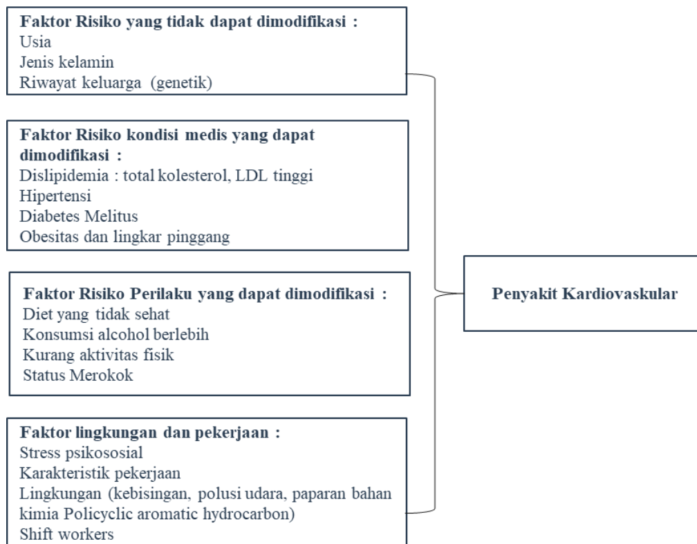
Gambar 2. Pemetaan Klasifikasi Faktor Risiko Penyakit Kardiovaskular