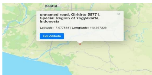
Gambar 2. Pusat Gudang Distribusi

Setelah ditentukan pusat gudang distribusi, selanjutnya menentukan biaya yang optimal yang harus dikeluarkan untuk transportasi dijabarkan pada Tabel 5. Rumus untuk biaya transportasi adalah: