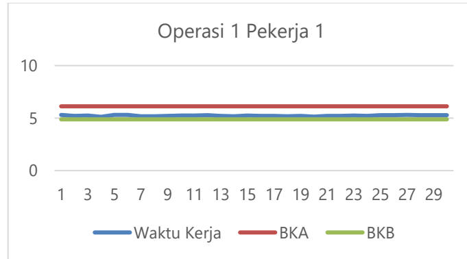
Gambar 2 Grafik uji keseragaman data operasi 1 pekerja 1

Grafik di atas menunjukkan bahwa data yang dikumpulkan sudah seragam, meskipun tidak semua data diambil dari BKA dan BKB.