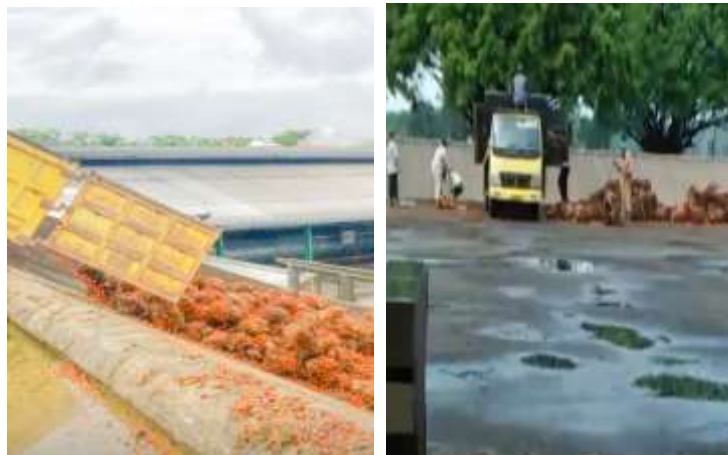
Gambar 2. Lokasi di Stasiun Loading Ramp (sortasi TBS)

Lokasi penelitian berada di PT. XYY, Kab. Kampar, titik lokasi penelitian di stasiun penyortiran TBS