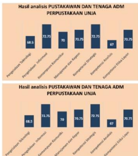
Gambar 2: Hasil Analisis Pengelolaan dan Kompetensi Pustakawan dan Tenaga Administrasi UPT Perpustakaan Universitas Jambi

Berikut ini adalah gambaran secara rinci dari 7 (tujuh) aspek pengelolaan dan kompetensi yang dianalisis untuk diketahui kondisinya, sebagai berikut: