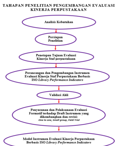
Gambar 1. Rancangan Prosedural Pengembangan Instrumen Kinerja Perpustakaan Berbasis ISO Library Performance Indicators.