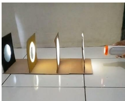
Percobaan Cahaya dapat merambat lurus

Untuk mengamati bagaimana cahaya dapat merambat lurus, kita memerlukan beberapa alat dan bahan. Yang pertama adalah sumber cahaya, seperti senter atau laser, yang akan digunakan untuk memancarkan cahaya. Selain itu, beberapa lembar kertas karton, kertas asturo, dan kardus yang telah dipotong bulat di tengahnya juga dibutuhkan untuk membentuk jalur cahaya. Langkah pertama dalam pelaksanaan eksperimen adalah menempatkan sumber cahaya di satu ujung ruangan. Kemudian, letakkan kertas hitam di sepanjang jalur cahaya yang diproyeksikan. Dengan cara ini, kita dapat mengamati bagaimana cahaya merambat lurus dari sumbernya dan membentuk bayangan yang jelas di kertas hitam. Pastikan bahwa posisi kertas dan sumber cahaya tetap stabil selama percobaan.