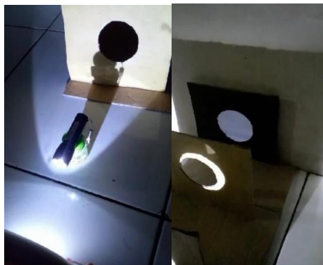
(parktikum Cahaya dapat dipantulkan)

Untuk melakukan percobaan pemantulan cahaya, beberapa alat dan bahan yang diperlukan adalah cermin datar, sumber cahaya, serta kertas putih atau gelap. Alat-alat ini akan membantu kita dalam mengamati fenomena pemantulan cahaya secara sederhana dan efektif. Langkah pertama dalam pelaksanaan praktikum adalah menempatkan cermin pada permukaan datar. Kemudian, arahkan sumber cahaya pada cermin sehingga Cahaya tersebut dipantulkan. Amati sudut datang dan sudut pantul cahaya yang terjadi. Pastikan bahwa pengamatan dilakukan dengan teliti untuk mendapatkan hasil yang akurat.