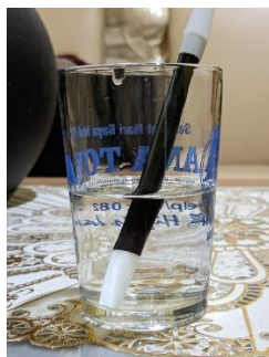
Percobaan Cahaya dapat dibiaskan

Untuk melakukan percobaan ini, peneliti menggunakan beberapa alat dan bahan sederhana. Siapkan gelas transparan yang bersih, air jernih, pensil atau sedotan lurus, dan sumber cahaya seperti lampu meja. Alat dan bahan ini akan membantu kita mengamati fenomena pembiasan cahaya dengan jelas dan mudah. Isi gelas transparan dengan air jernih hingga penuh atau cukup untuk menenggelamkan sebagian besar pensil. Pastikan air yang digunakan benar-benar jernih agar hasil pengamatan lebih akurat dan jelas terlihat. Masukkan pensil secara vertikal ke dalam gelas berisi air. Pastikan sebagian pensil berada di dalam air dan sebagian lagi di luar air, sehingga garis batas antara air dan udara terlihat jelas. Posisi ini penting untuk melihat perubahan jalur cahaya ketika melewati media yang berbeda. Amati pensil dari sisi gelas. Perhatikan apakah pensil terlihat lurus atau terbelah/tertekuk pada permukaan air. Amati dari beberapa sudut pandang yang berbeda untuk melihat efek pembiasan lebih jelas. Variasi sudut pandang akan membantu memahami bagaimana cahaya dibiaskan ketika melewati batas antara udara dan air.