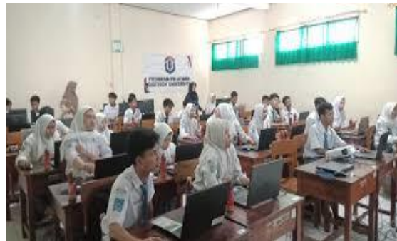
Gambar 2. Foto pelaksanaan hasil pembuatan logo merek siswa SMK

Berikut disajikan foto pelaksanaan pembuatan logo merek siswa kelas 12 SMKS PGRI 2 Lahat sebagai berikut: