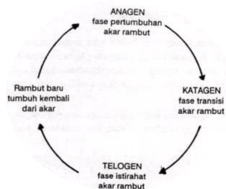
Gambar 1 Fase anagen pada rambut

Fase anagen pada rambut merupakan waktu yang paling lama pada usia rambut, rata – rata 1000 hari. Pada fase ini ditemukan mitosis yang cepat dan teratur di akar rambut, 90% dari akar rambut berada pada fase anagen(Rata,1990). Fase katagen merupakan fase transisi akar rambut. Kemudian diteruskan pada fase telogen yang merupakan fase istirahat akar rambut yang berlangsung sekitar 90 -100 hari. Setelah rambut rontok beralih ke arah fase anagen seperti yang tertera pada gambar 1