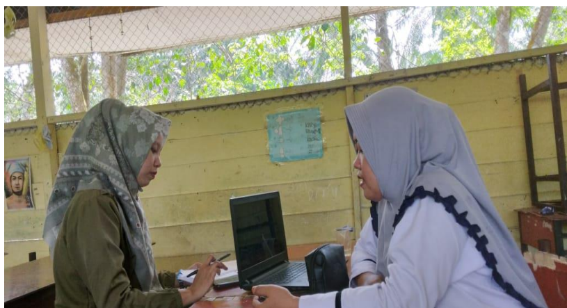
Gambar 2: Dokumentasi wawancara dengan Guru Kelas IV

Dari uraian diatas dapat disimpulkan bahwa perencanaan pembelajaran tematik pada pembelajaran daring di MIS Amal Ikhlas Sumberjo sudah dapat dikatakan baik walaupun kurang maksimal pada saat kegiatan pembelajaran berlangsung. Pada saat pembelajaran daring guru menggunakan Whatsapp untuk proses belajar mengajar. Guru memberikan pembelajaran secara langsung, dimana guru menjelaskan materi melalui pesan suara atau voice note . kemudian setelah itu, siswa diberi tugas.