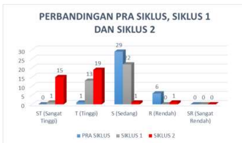
Diagram Perbandingan Efikasi diri Peserta Didik antara Pra Siklus,

Hasil Siklus I dan Siklus II Berdasarkan tabel dan digambarkan dengan diagram grafik diatas pada setiap siklusnya peserta didik mengalami peningkatan efikasi diri, dimana pada tahap kondisi awal atau pra penelitian peserta didik dalam kategori rendah masih terdapat terdapat 6 peserta didik, kemudian setelah diberikan tindakan disiklus I kategori rendah telah mengalami penurunan menjadi nol peserta didik. Pada siklus II mengalami peningkatan yang signifikan yaitu terdapat 19 peserta didik dalam kategori tinggi dan terdapat 15 peserta didik dalam kategori sangat tinggi .