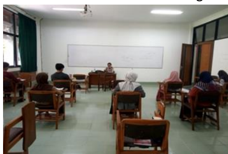
Gambar 1 Kondisi fisik mahasiswa saat pembelajaran di kelas

Faktor jasmaniah (fisiologis) baik yang bersifat bawaan atau dari lahir maupun yang diperoleh, misalnya penglihatan, pendengaran, struktur tubuh dan sebagainya (Ahmadi, 2013). Kondisi umum jasmani dan tonus (tegangan otot) yang menandai tingkat kebugaran organ-organ tubuh dan sendi-sendinya, dapat mempengaruhi tingkat semangat dan intensitas siswa dalam mengikuti pelajaran.