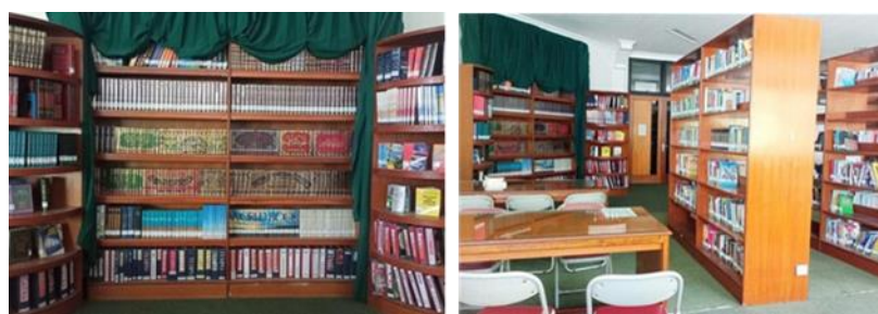
Gambar 4 Perpustakaan Fakultas Tarbiyah