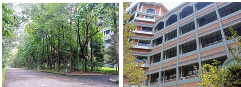
Gambar 3 Gedung perkuliahan

Lingkungan fisik yang berada pada sekitar mahasiswa yaitu berupa lingkungan perkuliahan tampak asri dan segar, gedung pembelajaran yang nyaman, dan terdapat pula di dalamnya perpustakaan-perpustakaan berisi buku dan kitab-kitab lengkap berkaitan dengan materi perkuliahan khususnya materi ilmu nahwu dan sharaf. Hal tersebut dapat dibuktikan melalui gambar lingkungan perkuliahan dan perpustakaan.