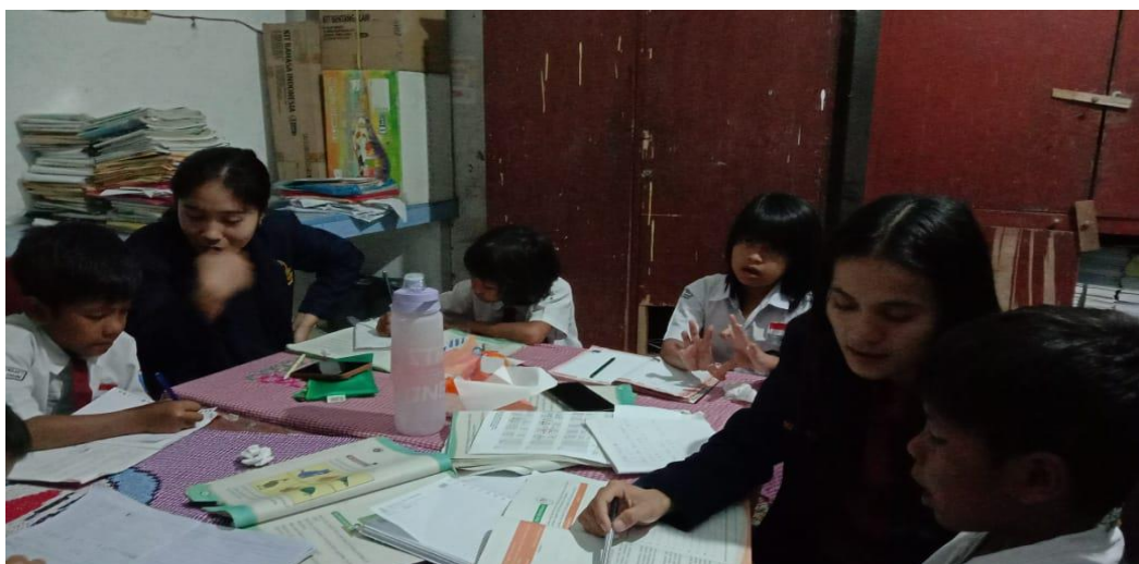
Gambar 2. Kegiatan Pembelajaran