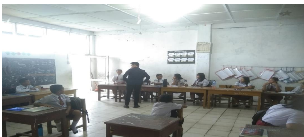
Gambar 3. Kegiatan Pembelajaran