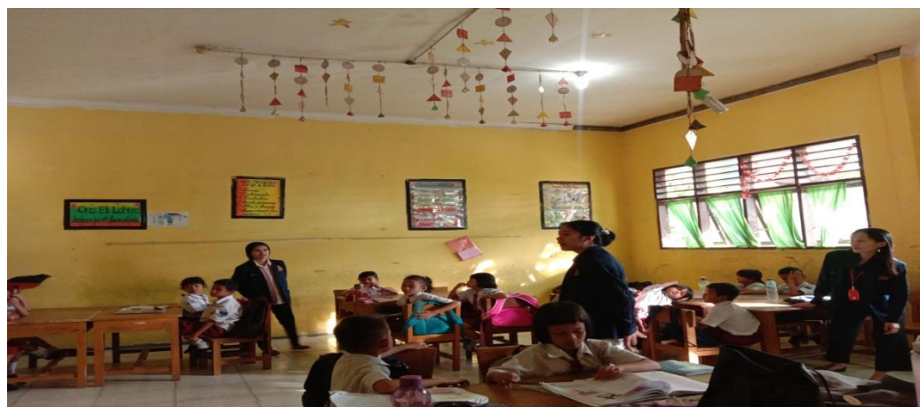
Gambar 4. Kegiatan Pembelajaran