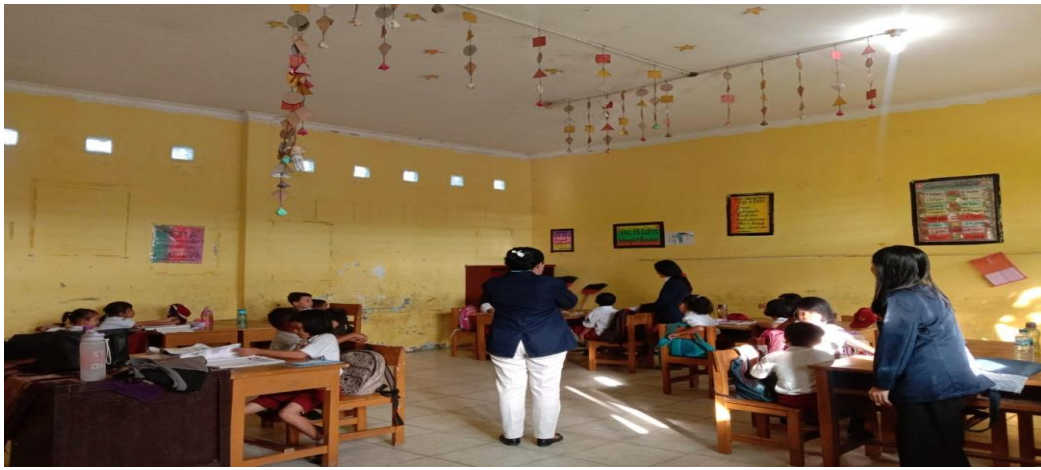
Gambar 5. Kegiatan Pembelajaran

Dari Gambar diatas menunjukkan kegiatan pembelajaran yang sedang dilakukan oleh tim PKM di SD SWASTA TRI SAKTI LUBUK PAKAM. Untuk mengajari sekaligus membimbing peserta didik agar mereka bisa mengerti materi pelajaran yang sedang disampaikan oleh guru didepan kelas. Melalui bimbingan belajar ini diharapkan semoga siswa/i SD SWASTA TRI SAKTI Lubuk Pakam lebih memperluas lagi pengetahuannya dalam bidang Literasi dan Numerasi. Literasi dan Numerasi sangat penting untuk dipelajari karna merupakan landasan untuk dapat mencari pengetahuan yang baru.