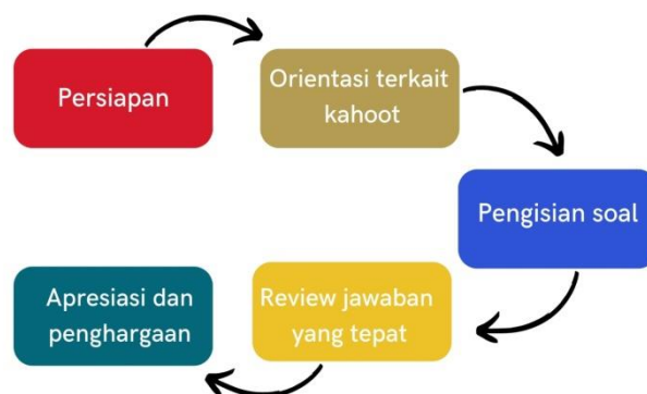
Gambar 1. Diagram kegiatan

Metode yang kami gunakan dalam penelitian ini merupakan metode kuantitatif dengan metode studi teks/pustaka. Studi pustaka yaitu mengadakan pengkajian berdasarkan analisis dokumen. Penelitian ini tidak menghimpun data secara interaktif melalui interaksi dengan sumber data manusia, tetapi peneliti menghimpun, mengidentifikasi, menganalisis, dan mengadakan sintesis data. Metode kuantitatif merupakan metode yang menekankan perhitungan dengan menggunakan data untuk menghitung hasil akhir. analisis data dilakukan dengan menghimpun seluruh hasil yang didapatkan oleh siswa. Dari data yang berhasil dihimpun terdapat 26 sampel siswa.