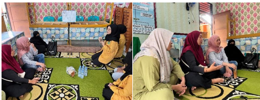
Gambar 1. Pelaksanaan Penentuan Prioritas Masalah

Penentuan masalah prioritas dilakukan menggunakan metode Urgency, Seriousness, Growth (USG), yakni pendekatan yang membantu menyusun urutan masalah berdasarkan tingkat kepentingannya untuk segera ditangani. Proses penetapan prioritas ini dilaksanakan melalui FGD bersama Ketua Posyandu Balita Permata, para kader posyandu, serta tokoh masyarakat. Dalam diskusi tersebut, setiap masalah dinilai berdasarkan aspek urgensi, tingkat keparahan, dan potensi pertumbuhannya dengan pemberian skor pada rentang 1–5. Masalah yang memperoleh skor tertinggi kemudian ditetapkan sebagai masalah utama yang harus segera diselesaikan.