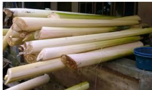
Gambar 2 : pohon pisang yang siap diolah menjadi keripik