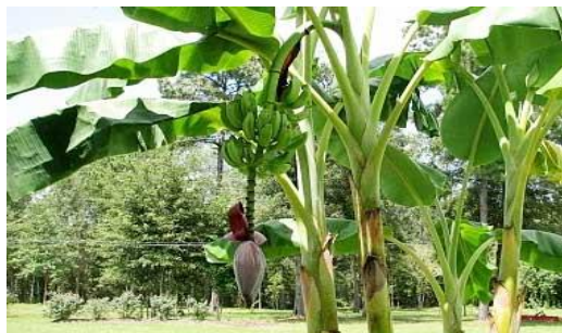
Gambar 1 : pohon pisang yang ada disekitar pemukiman warga kelurahan lopian

menjanjikan dan mampu meningkatkan perekonomian masyarakat ditengah pandemi covid 19. Mitra Kurang memahami tentang pemasaran produk melalui sosial media. Mitra membutuhkan pelatihan untuk meningkatkan pengetahuan dan keterampilan mengenai manajemen usaha, UMKM/UKM, manajemen keuangan, brand/merek, kemasan produk, promosi dan pemasaran online. Mitra membutuhkan peralatan pendukung untuk pengolahan pohon pisang seperti kompor gas, wajan, spatula, dan bahan pendukung lainnya untuk pengemasannya. Mitra membutuhkan rancangan kemasan produk yang baik.