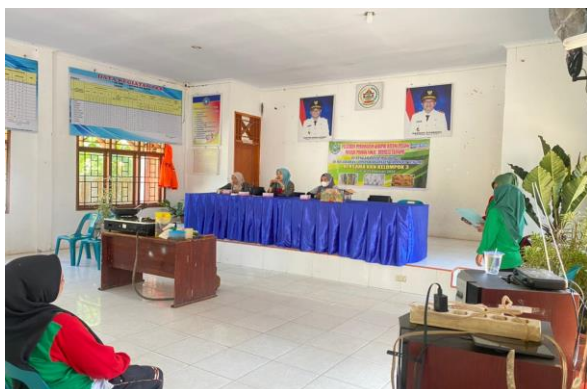
Pemberian materi dalam kegiatan pelatihan