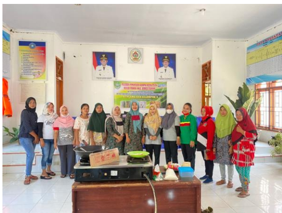
Bersama dengan ibu kepling dan ibu – ibu di kelurahan lopian

6) Isi dengan tidak ada, draft, proses, editing atau sudah terbit ver ISBN