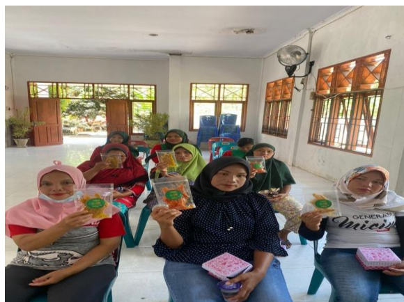
Ibu ibu kelurahan sedang melihat langsung contoh produk kribang yang sudah jadi