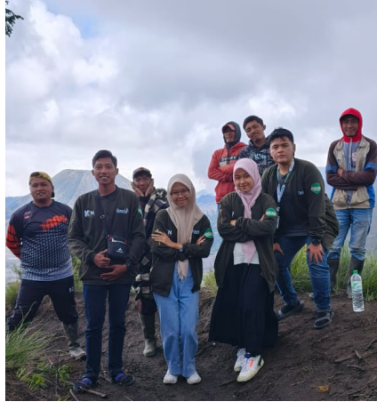
Gambar 2. Dokumentasi Kegiatan Survey

Setelah dilakukan survey, didapatkan ide untuk memberikan pelatihan yang tepat di Desa Mororejo. Melalui pelatihan ini dibahas satu-persatu mengenai packaging suatu produk yang penting dalam menarik perhatian konsumen, kiat-kiat dalam membuat packaging, pemberian contoh packaging yang baik. Packaging adalah komponen dalam suatu produk yang berisi terkait informasi detail produk (Bastomi & Sholehuddin, 2022). Produk yang memiliki packaging yang baik dan bagus tentu akan menarik minat beli calon konsumen. Maka dari itu, packaging diperlukan dalam pengembangan UMKM. Dengan adanya pelatihan ini diharapkan ibu-ibu PKK, khususnya di Desa Mororejo dapat memperoleh informasi dan dapat mengakses ilmu yang mudah dari sumber internet.