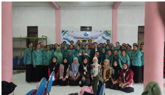
Gambar 2. Foto Kegiatan Pelatihan Bersama Ibu-ibu PKK Desa Mororejo

Gambar di atas merupakan dokumentasi dari kegiatan pelatihan yang sudah dilakukan. Adanya pelatihan bertujuan untuk memberikan contoh peningkatan produk unggulan melalui packaging yang menarik beserta demonstrasi yang berguna untuk menghasilkan ide keterampilan untuk meningkatkan UMKM. Berkenaan dengan hal ini, diadakan sosialisasi mengenai pemberian contoh pengemasan produk yang baik. Produknya memakai bahan baku yang banyak dihasilkan di Desa Mororejo, yaitu kentang. Dari bahan baku tersebut diproduksi menjadi kentang mustofa yang sebelumnya di rebranding menjadi kemari (kentang manis gurih).