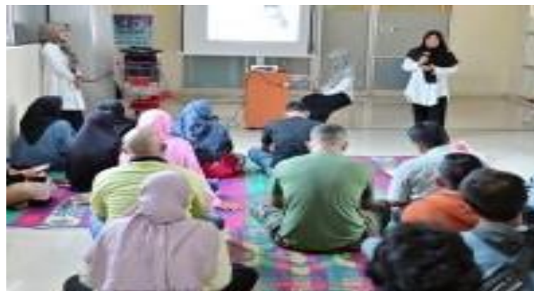
Gambar 2. Tim Pengabdian Memberikan Pelatihan Teknik Relaksasi