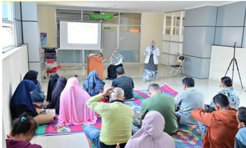
Gambar 1. Tim Pengabdian Memberikan Penyuluhan kepada Peserta

pelatihan ini digunakan terapi relaksasi otot progresif dengan pertimbangan dapat sekaligus menjadi sarana untuk berolahraga