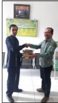
Gambar 1. Penyerahan Donasi Buku Dari Donatur.

Langkah selanjutnya mengaktifkan rumah baca sementara sebagai wadah atau tempat anak usia sekolah untuk menumbuhkan minat baca mereka. Kegiatan menumbuhkan minat baca anak usia sekolah di Perumahan Bumi Mandala 2 Desa Kualu Kabupaten Kampar dilakukan dengan cara memberikan berbagai macam ragam buku bacaan yang bisa dibaca oleh anak dan memberikan buku-buku yang memiliki bentuk permainan di dalamnya.