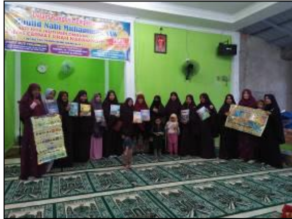
Gambar 3. Penyerahan Buku Wakaf Ke Pengurus Masjid Al-Hidayah Perumahan Bumi Mandala 2

Selain kegiatan menumbuhkan minat baca pada anak usia sekolah. Kegiatan PkM juga mendonasikan buku bacaan kepada masjid perumahan hasil dari wakaf warga sekitar perumahan dan wakaf dari warga di luar perumahan. Bentuk wakafnya adalah penyerahan buku bacaan tentang Nabi Muhammad SAW kepada pihak pengurus masjid Al-Hidayah Perumahan Bumi Mandala 2 Desa Kualu Kabupaten Kampar.