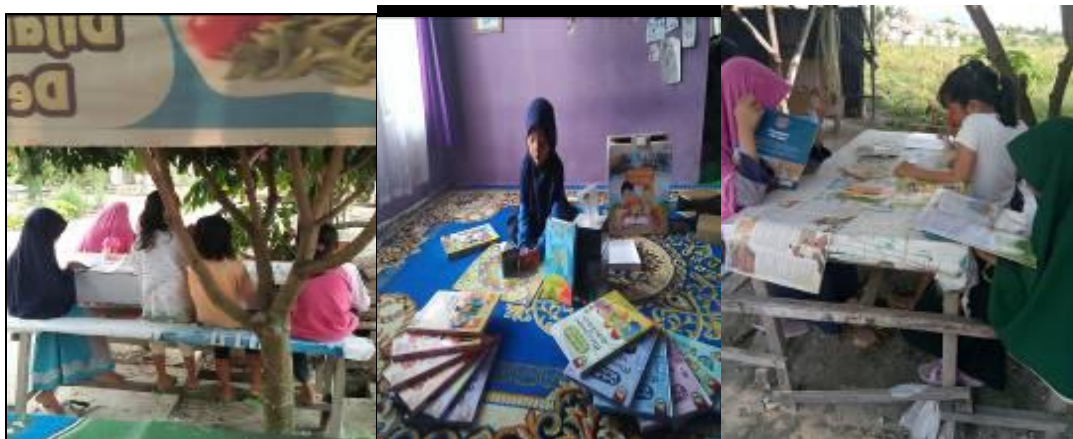
Gambar 2. Kegiatan Membaca dan Bermain Anak Usia Sekolah

Langkah selanjutnya mengaktifkan rumah baca sementara sebagai wadah atau tempat anak usia sekolah untuk menumbuhkan minat baca mereka. Kegiatan menumbuhkan minat baca anak usia sekolah di Perumahan Bumi Mandala 2 Desa Kualu Kabupaten Kampar dilakukan dengan cara memberikan berbagai macam ragam buku bacaan yang bisa dibaca oleh anak dan memberikan buku-buku yang memiliki bentuk permainan di dalamnya.