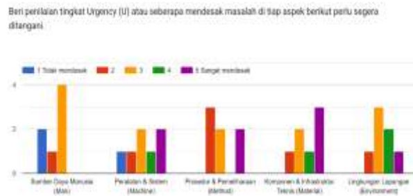
Gambar 2 Diagram Penilaian Urgency (U)

Setiap responden memberikan skor 1–5 untuk aspek Urgency (U), Seriousness (S), dan Growth (G) pada masing-masing faktor. Skor USG diperoleh dengan mengalikan nilai skor yang dipilih dengan jumlah responden pada setiap pilihan, kemudian dijumlahkan untuk mendapatkan nilai total tiap aspek. Pendekatan ini merepresentasikan persepsi kolektif teknisi terhadap tingkat kedaruratan, dampak, dan potensi perkembangan masalah. Hasil penilaian USG selanjutnya disajikan dalam bentuk diagram distribusi Urgency, Seriousness, dan Growth sebagaimana ditunjukkan pada Gambar di bawah ini.