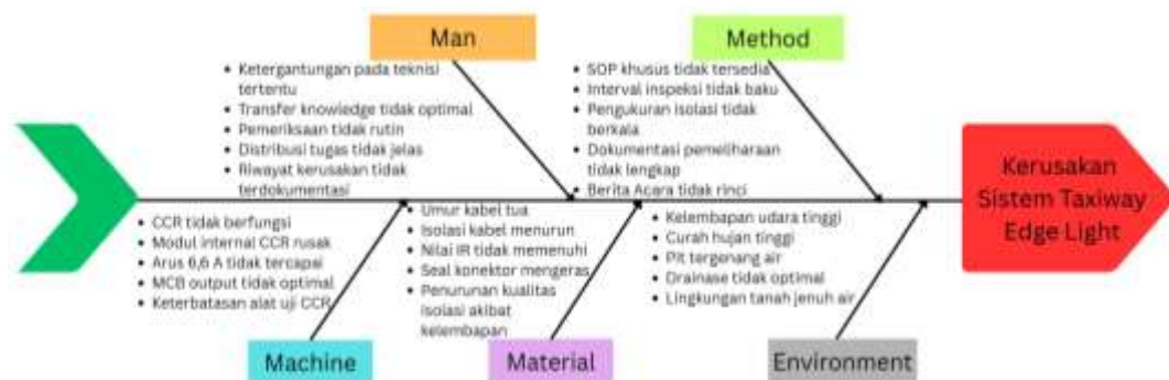
Gambar 1 Fishbone diagram