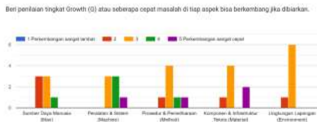
Gambar 4 Diagram Penilaian Growth (G)

Berdasarkan diagram penilaian USG, selanjutnya dilakukan perhitungan skor untuk masing-masing faktor dengan mengalikan skor penilaian dengan jumlah responden pada setiap aspek utama. Hasil perhitungan tersebut kemudian direkapitulasi dan disajikan secara rinci dalam Tabel di bawah ini sebagai dasar penentuan total skor dan peringkat prioritas masalah.