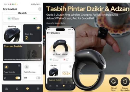
Gambar 2. Contoh Desain Konten untuk digital marketing

Kegiatan pengabdian Masyarakat ini mendapatkan pendanaan pada program Pengabdian kepada Masyarakat dan KKN tahun anggaran 2025 Oleh Lembaga Penelitian dan Pengabdian Masyarakat Universitas Nahdlatul Ulama Surabaya. Dengan adanya kegiatan pengabdian masyarakat berupa implementasi desain konten video digitalisasi marketing di PT Unggul Teknologi Cerdas yang dapat membantu promosi produk dan yang pastinya akan berimbas ke volume penjualan. Berikut adalah bentuk desain konten