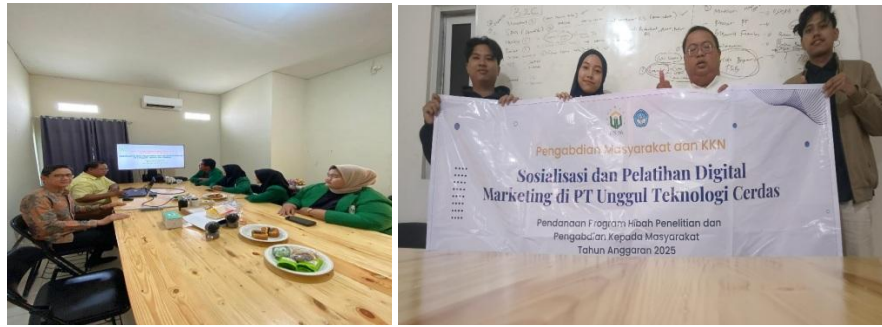
Gambar 2. Serangkaian Kegiatan Pengabdian dan KKN di PT Unggul Teknologi Cerdas