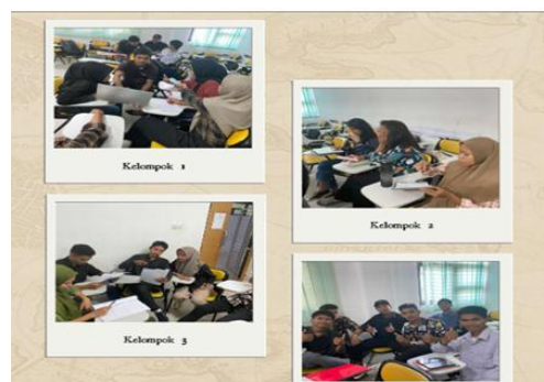
Gambar 1. Hasil Tutorial Pelaksanaan Kegiatan

Pada tahap pelatihan, kegiatan awal dilakukan dengan memberikan tutorial kepada peserta kegiatan. Dalam kegiatan tutorial, tim pengabdian melakukan presentasi beberapa materi kepada peserta kegiatan. Adapun materi yang dimaksud meliputi konsep jurnalistik, kode etik jurnalistik, konsep buletin, tata cara penyusunan dan desain pembuatan buletin serta pembentukan tim redaksi pada peserta kegiatan. Adapun deskripsi kegiatan tersebut seperti pada gambar berikut.