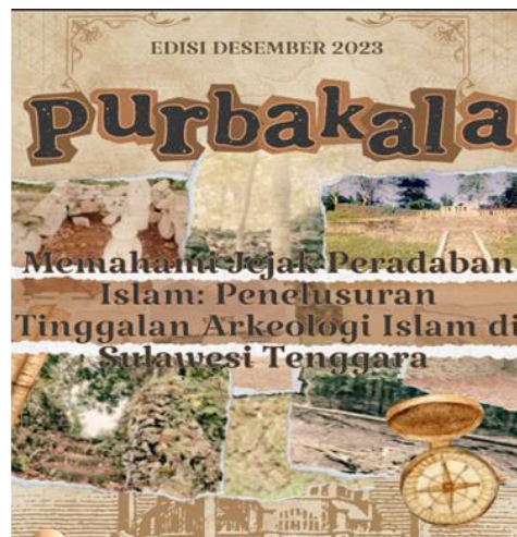
Gambar 2. Cover Jurnal Hasil Cipta Peserta Pelatihan

Tim redaksi yang berhasil terbentuk terdiri dari pimpinan redaksi, coordinator lapangan, redaktur rubrik, editor dan bendahara. Masing-masing bagian dalam tim redaksi ini memiliki tugas dan fungsi yang berbeda. Namun, soliditas dan sinergi dari masing-masing bagian mampu bekerja sama dalam menghasilkan Buletin Purbakala Edisi Desember 2023. Hal inilah yang menjadi kunci keberhasilan dalam mewujudkan pencapaian tujuan pelaksanaan kegiatan pengabdian dan peserta kegiatan. Hal ini terjadi karena masing-masing bagian tim fokus, komitmen dan bekerja sama dalam merealisasikan tugas pokok dan fungsinya. Sebagai contoh pada gambar di atas, pimpinan redaksi yang diketua oleh Jaimun bertugas melakukan monitoring dan evaluasi terkait hasil kegiatan semua anggota tim. Redaktur rubrik yang diketui oleh Ceril Putri Andini bertugas memastikan rubrik dari buletin telah rampung dibuat oleh anggota lainnya. Selanjutnya, tim redaksi ini dibawah pengawasan langsung oleh tim pengabdian yang secara sinergis menyusun cover Buletin Purbakala Edisi Desember 2023. Selain itu, peserta kegiatan juga mendesain dan menginovasi tampilan gambar hasil dokumentasi dari data yang dirujuk dalam Buletin Purbakala Edisi Desember 2023, menarasikan kembali hasil dokumentasi tersebut, serta menyusun daftar pustaka dari sumber yang dirujuk. Adapun kegiatan yang dimaksud sebagaimana yang disajikan pada gambar berikut.