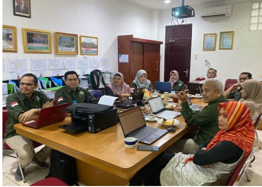
Gambar 1. Pemaparan Tutor Kepada Dosen STIE Ganesha

untuk berkontribusi pada literatur akademik. Rasa percaya diri ini penting untuk mendorong mereka terus menulis dan menghasilkan karya ilmiah yang bermanfaat.