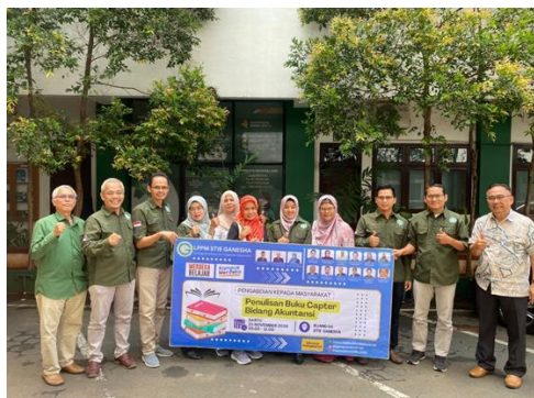
Gambar 2. Peserta Pealtihan Pose Bersama Setelah Papan Materi

Secara keseluruhan, kegiatan ini berhasil meningkatkan produktivitas akademik dosen, memperkuat kontribusi mereka dalam pengembangan literatur ilmiah, serta mendorong adopsi prinsip keberlanjutan dalam praktik akuntansi. Hasil yang dicapai menunjukkan bahwa pelatihan ini tidak hanya berdampak jangka pendek, tetapi juga memberikan manfaat jangka panjang dalam memperkuat posisi STIE Ganesha sebagai institusi pendidikan yang berorientasi pada masa depan bisnis yang berkelanjutan.