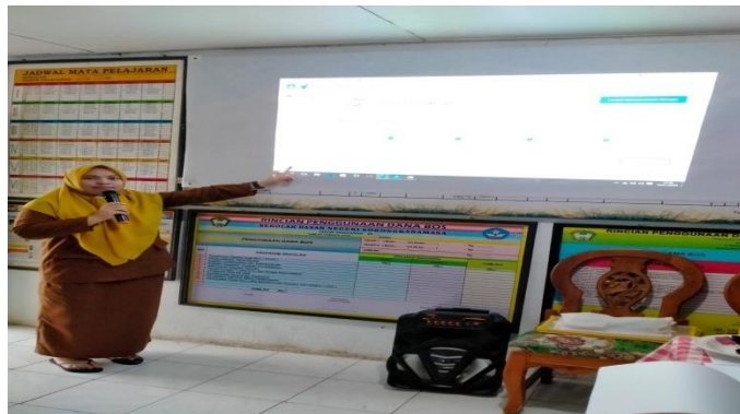
Gambar 3 Penyampaian Materi Hari Ketiga

Pendampingan hari ketiga TIM PKM melakukan pendampingan secara luring dengan materi mengenai Media pembelajaran berbantuan TIK. Selanjutnya TIM PKM memeriksa kemampuan kerja guru dari hasil unjuk kerja yang dilakukan pada hari sebelumnya. Dari hasil unjuk kerja guru, dihasilkan beberapa media pembelajaran yang memanfaatkan TIK, seperti video, PPT, dan aplikasi-aplikasi pengerjaan soal latihan untuk siswa yang nantinya akan digunakan sebagai Lembar Kerja Peserta Didik (LKPD).