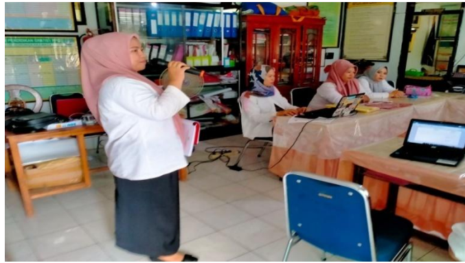
Gambar 3 Penyampaian Materi Hari Kedua