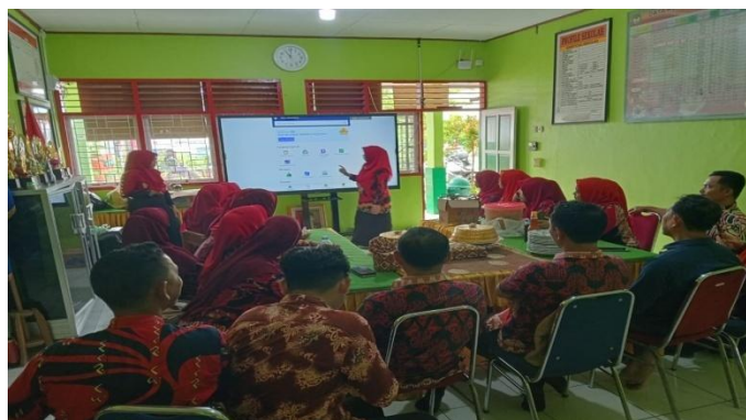
Gambar 2 Penyampaian Materi Hari Pertama

Pendampingan dilakukan selama 3 hari dengan kegiatan sebagai berikut: Pendampingan hari pertama dilakukan secara daring sekaligus membuka kegiatan pendampingan, pelaksanaan hari kedua TIM PKM menyampaikan mengenai pengenalan literasi digital, perangkat literasi digital, dan pemanfaatannya.