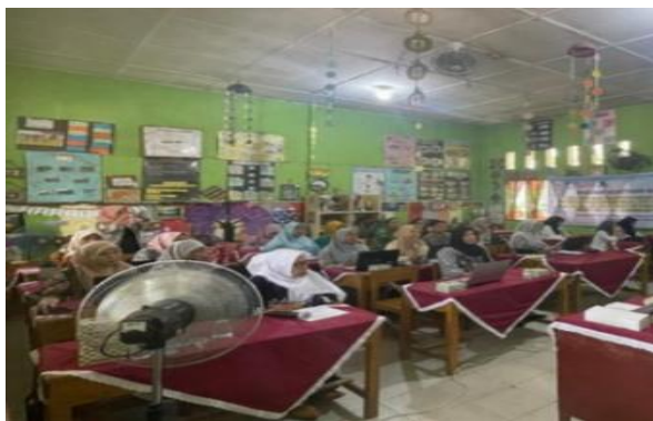
Gambar 3 Kegiatan Pendampingan

Hasil pretest menunjukkan nilai rata-rata 49,5 dengan kriteria di bawah KKM. Kegiatan pada pertemuan pertama meliputi penyampaian tujuan kompetensi yang akan dicapai dalam kegiatan pengabdian masyarakat yaitu pengertian, hakikat, fungsi dan manfaat media pembelajaran komik berbasis kearifan lokal sulawesi selatan. Dilanjutkan penyajian materi tentang pengertian, hakikat, fungsi, dan manfaat media pembelajaran komik berbasis kearifan lokal sulawesi selatan. Pemateri memperlihatkan gambar-gambar kearifan lokal di sekitar yang dapat dimanfaatkan untuk membuat media pembelajaran. Terakhir pemateri bersama peserta bersama-sama membuat kesimpulan dari pemaparan materi pengabdian masyarakat. Peserta pengabdian antusias ikut serta menyimpulkan materi pengabdian pada pertemuan pertama dengan jawaban yang benar.