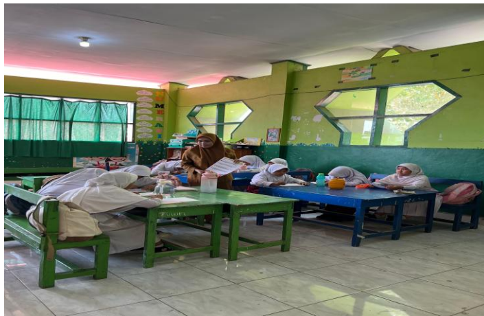
Gambar 5 Siswa-Siswa SDN Sungguminasa V

Pentingnya implementasi kearifan lokal dalam pembelajaran sejalan tujuan pendidikan. Hal itu didukung dengan penelitian (Krisdayanti & Trisiana, 2019) nilai-nilai positif kearifan lokal hendaknya diperkenalkan kepada siswa, agar mereka dapat ikut mengembangkan budaya bangsa yang mulai tergerus dengan budaya luar. Pendidikan kearifan lokal mengajarkan kepada siswa bagaimana bermasyarakat yaitu menghadapi permasalahan dalam kehidupan baik disekolah maupun di luar sekolah melalui penerapan nilai-nilai yang terkandung di dalamnya. Terutama bagi siswa sekolah dasar menjadi sangat penting pembentukan karakter melalui pendidikan kearifan lokal sehingga dapat menjadi vaksin ketika menempuh pendidikan selanjutnya atau terjun ke masyarakat. Karakter budaya lokal akan mudah dibentuk dan diserap oleh siswa pada usia SD. Guru sebagai manager dalam mengelola pembelajaran di kelas, hendaknya dapat mendesain secara inovatif pembelajaran berbasis kearifan lokal lebih mudahnya seperti dalam kegiatan pengabdian masyarakat ini yaitu melalui media pembelajaran.