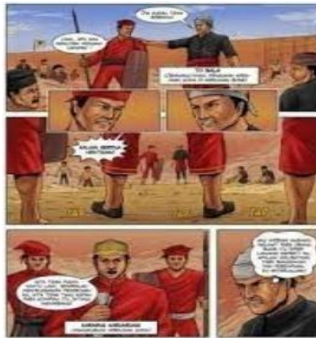
Gambar 4 Komik Berbasis Kearifan Lokal Sulsel

Pertemuan kelima merupakan pertemuan terakhir kegiatan pengabdian masyarakat di SDN Sungguminasa V, semua peserta berjumlah 20 hadir dengan membawa hasil akhir kegiatan pengabdian berupa media pembelajaran komik berbasis kearifan lokal sulawesi selatan dan buku panduan media pembelajaran komik berbasis kearifan lokal sulawesi selatan. Setiap kelompok mempresentasikan medianya, pemateri memberikan penilaian masing-masing media pembelajaran dan memberikan penghargaan kepada kelompok yang membuat media pembelajaran terbaik.