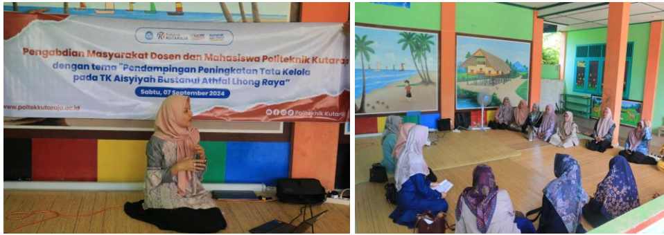
Gambar 2. Foto Dokumentasi Kegiatan