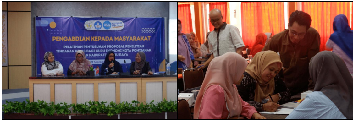
Gambar 3. Simulasi penyusunan dan penyampaian proposal

Ketika tiba di sesi presentasi proposal, antusiasme peserta semakin meningkat. Setiap kelompok diberikan kesempatan untuk memaparkan proposal yang telah mereka susun di depan peserta lainnya dan narasumber. Presentasi ini tidak hanya menjadi ajang untuk menunjukkan hasil kerja mereka, tetapi juga menjadi forum diskusi yang sangat produktif. Beberapa kelompok mendapatkan masukan berharga dari peserta lain mengenai cara memperbaiki dan menyempurnakan proposal mereka. Dalam proses ini, peserta secara aktif bertukar pikiran dan pengalaman, yang membuat suasana pelatihan menjadi dinamis dan interaktif.