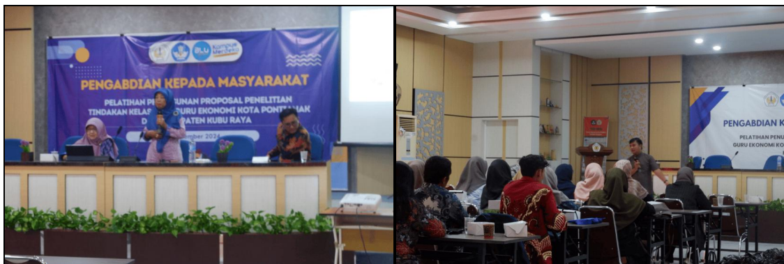
Gambar 2. Penyampaian Materi

Dalam sesi pertama yang berfokus pada pengenalan PTK, instruktur memaparkan konsep dasar serta manfaat PTK bagi guru dalam upaya perbaikan proses belajar mengajar. Di sini, para peserta mulai memahami bahwa PTK tidak hanya membantu guru dalam menyelesaikan masalah pembelajaran, tetapi juga meningkatkan kualitas pengajaran secara berkelanjutan. Beberapa peserta mengakui bahwa sebelumnya mereka merasa PTK adalah sesuatu yang rumit, namun setelah mengikuti sesi ini, mereka mulai mendapatkan gambaran yang lebih jelas tentang bagaimana PTK dapat diterapkan secara praktis.