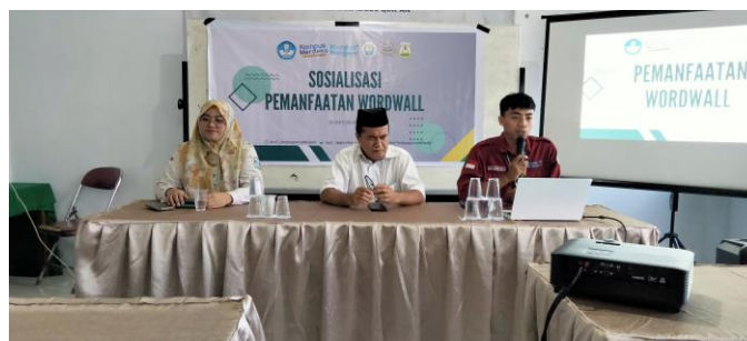
Gambar 1. Photo Pembukaan

Pelatihan ini bertujuan untuk meningkatkan kompetensi guru bahasa Inggris di PPM Al-Ikhlas dalam memanfaatkan teknologi digital untuk pembelajaran. Fokus utama pelatihan adalah pada pengenalan dan pemanfaatan aplikasi WordWall. Dengan pelatihan ini, diharapkan para guru dapat lebih mudah memahami cara penggunaan WordWall dan memperoleh referensi model pembelajaran baru yang lebih menarik dan interaktif bagi peserta didik. Penggunaan game pembelajaran dalam WordWall diharapkan dapat memicu semangat belajar siswa dan sekaligus mengembangkan kreativitas para guru dalam merancang kegiatan pembelajaran.