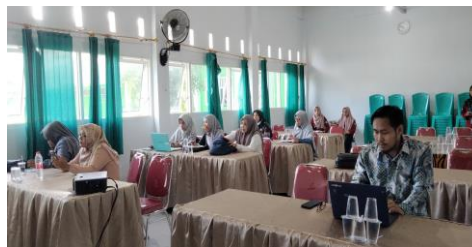
Gambar 5. Kegiatan pesertan mengguakan WordWall

Pada sesi terakhir yang penuh antusiasme, para peserta tidak hanya mendengarkan materi, tetapi juga secara aktif berkreasi dengan merancang template pembelajaran bahasa Inggris yang unik menggunakan aplikasi WordWall. Setiap peserta tampak begitu bersemangat dalam mengeksplorasi berbagai fitur yang ditawarkan oleh WordWall untuk menciptakan kegiatan belajar yang lebih menarik dan interaktif bagi siswa mereka. Kegiatan ini juga menjadi wadah bagi para guru untuk saling berbagi ide dan pengalaman dalam mengimplementasikan teknologi dalam pembelajaran.