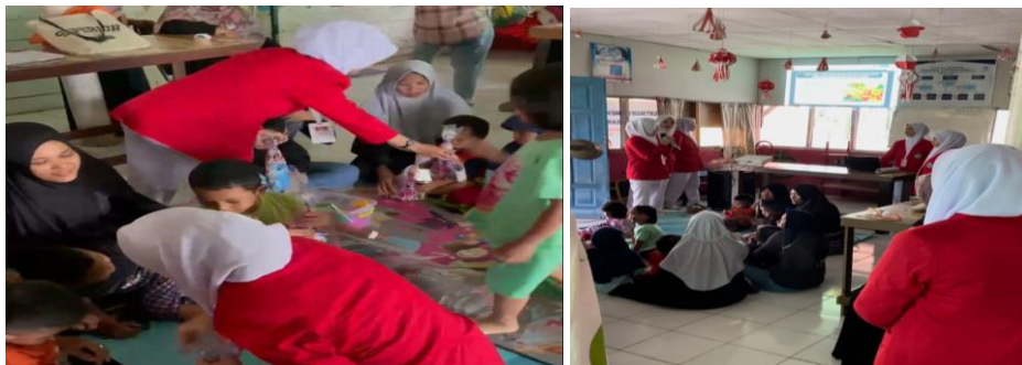
Gambar 1. Pembagian makanan pada anak peserta penyuluhan dan Pemaparan Materi

Pelaksanaan kegiatan penyuluhan mengenai "Tumbuh Kembang Anak" ini dilakukan di Posyandu Gurindam Rindu 1 di Pulau Buluh. Kegiatan penyuluhan ini dilaksanakan penyampaian materi, dan membagikan media promosi kesehatan berupa leaflet sebagai sumber baca dalam menghadiri acara penyuluhan, leaflet yang di bagikan berjudul "Tumbuh Kembang Anak". Setelah materi Tumbuh Kembang Anak disampaikan oleh penyaji materi, kemudian dilanjutkan dengan responden diberikan kesempatan untuk bertanya mengenai materi yang telah disampaikan oleh penyaji materi. Hasil yang di dapatkan dari pembagian leaflet, penyampaian materi Tumbuh Kembang Anak, menunjukkan peningkatan, karena saat kami sebagai para mahasiswa membagikan sebuah pertanyaan mengenai "Apa Itu Tumbuh Kembang Anak?" para peserta penyuluhan, terutama ibu-ibu yang hadir dapat menjawab pertanyaan tersebut.