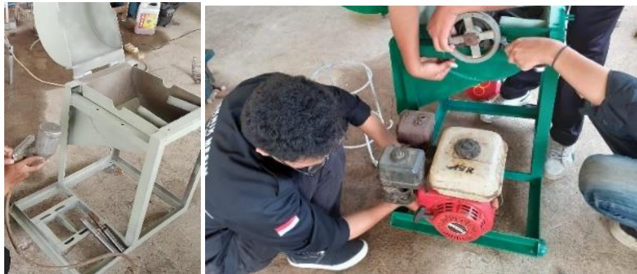
Gambar 5. Pengecatan dan perakitan ulang komponen mesin

berwana abu-abu dan lapisan cat utama berwarna hijau. Pelapisan cat dasar dan utama dilakukan untuk mencegah korosi komponen mesin dari faktor lingkungan dan menambah estetika. Setelah pengecatan selesai, dilanjutkan tahap mengeringkan lalu merakit kembali semua komponen mesin (assembly) yang ditunjukkan pada gambar 5.