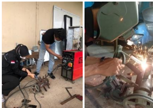
Gambar 4. Pengelasan pisau pencacah

Pada tahap pengerjaan, diawali dengan pembongkaran komponen pisau yang digunakan pada mesin. Pisau tersebut diketahui kondisinya bahwa sudah berkarat dan beberapa mata pisaunya hancur. Mesin ini sudah lama tidak digunakan dan jarang mendapatkan perawatan seperti pelumasan oli. Setelah mesin dibongkar, dilakukan pengambilan mata pisau yang lama untuk diganti dengan mata pisau yang baru. Selanjutnya mata pisau tersebut dilakukan pengelasan mesin las SMAW dengan elektroda 3,2 milimeter jenis RD-260. Bahan pisau yang baru menggunakan material besi plat strip dengan ketebalan 7 milimeter. Dilakukan setting mesin las dan mulai mengelas pada pisau pencacah seperti gambar 4.