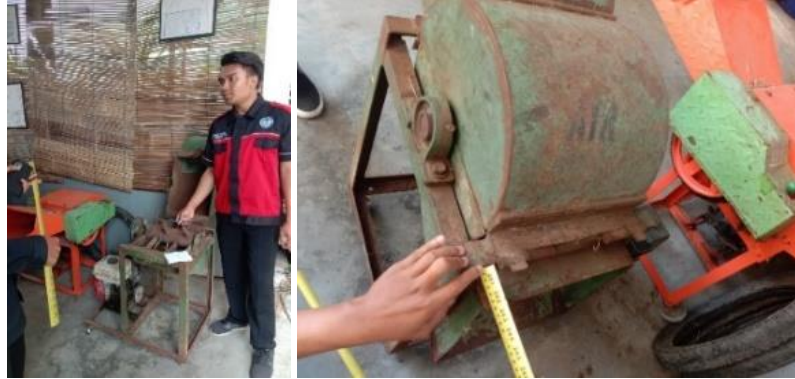
Gambar 2. Observasi dan pengukuran dimensi mesin

Dengan memahami masukan dari teknisi, diharapkan mesin ini dapat kembali digunakan agar menghasilkan produk pupuk dari cacahan limbah organik secara efektif setelah diperbaiki.