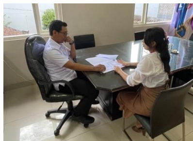
Gambar 1. Survey Kepada Mitra

Dengan fokus pada peningkatan keterampilan public speaking dan pengenalan dasar-dasar digital marketing, program ini akan memberikan solusi yang komprehensif terhadap permasalahan masyarakat yang diidentifikasi. Melalui program ini, kami berharap para guru di SMKTI Bali Global Jimbaran akan memiliki keterampilan yang diperlukan untuk lebih efektif berkomunikasi dan mempromosikan sekolah mereka, sehingga akan menciptakan dampak positif dalam dunia pendidikan lokal dan membantu sekolah dalam mencapai tujuan mereka.