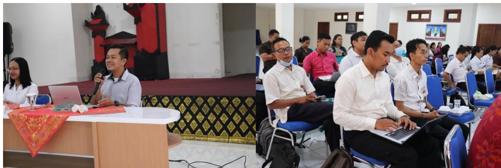
Gambar 5 Kegiatan Hari pertama

Deskripsi: Kegiatan akan ditutup dengan sesi penilaian dan refleksi. Peserta akan diberikan kesempatan untuk memberikan umpan balik tentang pelatihan ini dan bagaimana mereka merasa terlibat. Instruktur akan menyampaikan pesan terakhir, memberikan saran untuk langkah selanjutnya, dan memberikan sertifikat kepada peserta sebagai penghargaan atas partisipasi mereka. Beberapa dokumentasi kegiatan