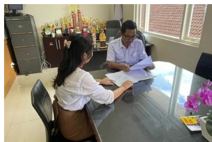
Gambar 2. Analisa Mitra