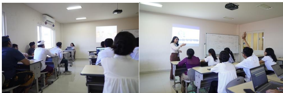
Gambar 6 Kegiatan hari kedua