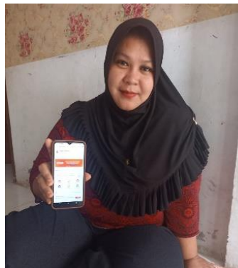
Gambar .2 sosialisasi pemasaran digital kepada pelaku usaha umkm