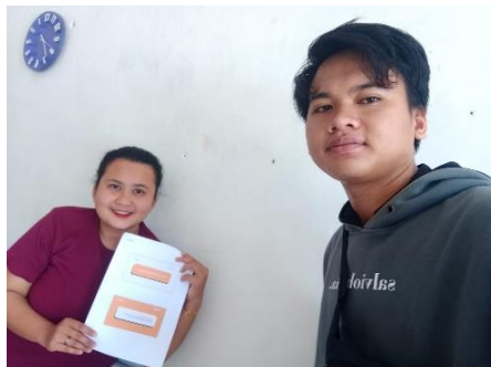
Gambar .1 sosialisasi Metode Manajemen Usaha kepada ibu rumah tangga pelaku usaha umkm