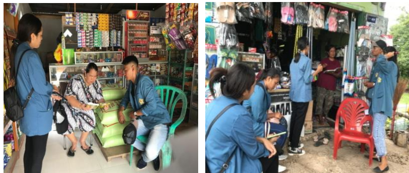
Gambar 4, dan 5 pelatihan pencatatan pembukuan pada UMKM