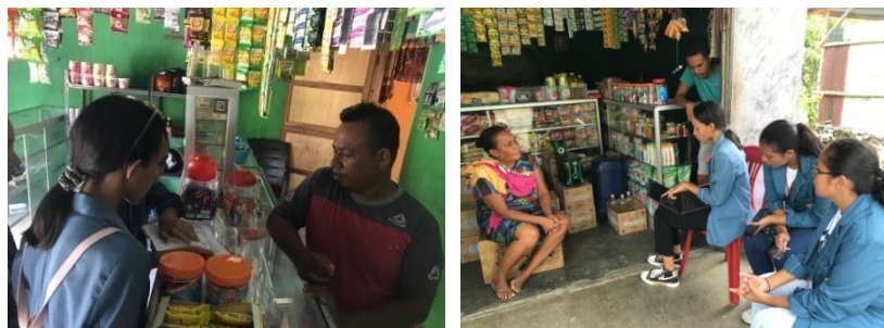
Gambar 1 dan 2 Sosialisasi pembukuan sederhana pada UMKM

Kegiatan ini berlangsung di empat lokasi yang berbeda, spesifiknya di setiap kios UMKM. Berlangsung pada tanggal 2 Februari 2024, kegiatan ini terfokus pada berinteraksi langsung dengan pemilik usaha mikro, kecil, dan menengah (UMKM). Kegiatan awal yang dilakukan adalah memberikan pembelajaran tentang pentingnya memisahkan keuangan pribadi dan keuangan usaha, serta pentingnya konsistensi dalam pencatatan pembukuan dan metode serta format sederhana untuk mencatatnya. Program pembelajaran tersebut ditujukan langsung kepada para pelaku usaha melalui interaksi langsung, komunikasi lisan, dan diskusi terbuka hingga UMKM memahami konsep dasar pembukuan sederhana dan dapat menyusun catatan keuangan yang sederhana. Melalui pembelajaran ini, pemilik UMKM mulai memiliki pemahaman dan wawasan tentang pembukuan sederhana serta mulai menyadari pentingnya memisahkan keuangan pribadi dan usaha, serta konsistensi dalam pencatatan