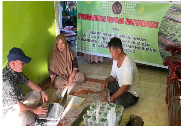
Gambar 4. Pelatihan pemasaran oleh pemateri