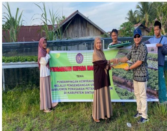
Gambar 2. Bantuan Modal Usaha untuk pembelian bibit

Selain pembelian peralatan usaha, kegiatan pengabdian ini juga memberikan bibit Selada untuk memperlancar proses produksi. Tujuan dari pemberian modal finansial tersebut adalah untuk mengembangkan usaha petani selada hidroponik agar mampu melakukan proses produksi lebih produktif. Proses pelaksanaan kegiatan ini adalah dengan memberikan bantuan pembelian bibit tanaman selada.