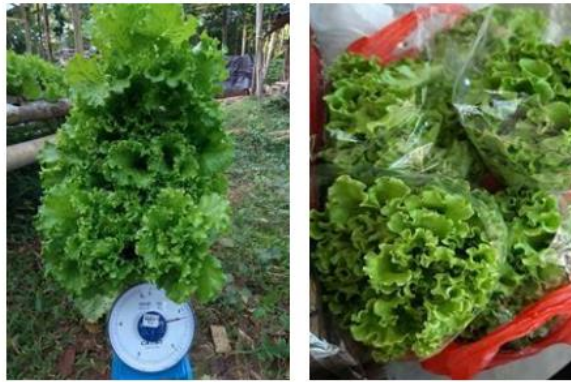
Gambar 6. Produk Selada Hidroponik