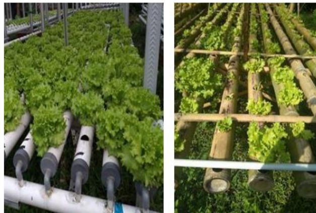
Gambar 5. Alat produksi hidroponik menggunakan bambu (b) dan dikembangkan menggunakan pipa (a)

Selain kurangnya pemahaman terkait konsep pemasaran, para petani juga mengalami kesulitan dalam menghadapi pesaing selada konvensional yang harganya relative lebih murah, atau bahkan petani hidroponik yang sudah memiliki alat produksi pertanian yang besar dan memiliki brand yang jelas. Solusi yang ditawarkan oleh tim peneliti saat melakukan pendampingan adalah menghadapi pesaing sikap yang professional dan cerdas artinya, para petani selada hidroponik harus mengedepankan unsur kompetisi secara sehat, dan terus menjaga kualitas selada dengan baik, serta menambah jumlah kuantitas selada agar para konsumen tidak kehabisan stok saat melakukan pemesanan. Produk selada yang ada harus terus diperbaiki kualitasnya atau dijaga kualitasnya. Salah satu caranya adalah dengan terus berinovasi sesuai dengan perkembangan zaman. Selain itu, juga harus ada SDM atau petani yang khusus menangani bagian pemasaran, membuat kalimat promosi yang apik serta memikirkan pengemasan yang sesuai kebutuhan konsumen. Kegiatan ini juga dijelaskan melalui kegiatan pelatihan.