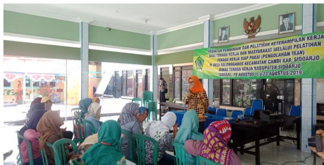
Gambar 3. Dokumentasi Kegiatan

Dokumentasi kegiatan dapat dilihat pada gambar 3 di bawah ini :