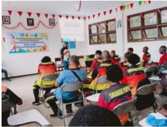
Gambar 2. Pelatihan Gizi Olahraga Bagi Siswa, Guru, dan Pelatih SMAN Keberbakatan Olahraga Papua