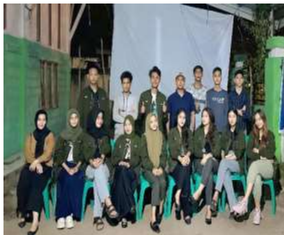
Gambar 2. Dokumentasi Bersama