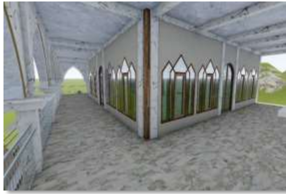
Gambar 6. Model masjid yang di desain