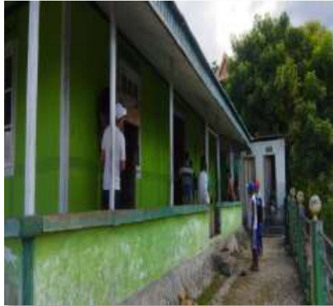
Gambar 3. Pengukuran badan masjid dan lainnya