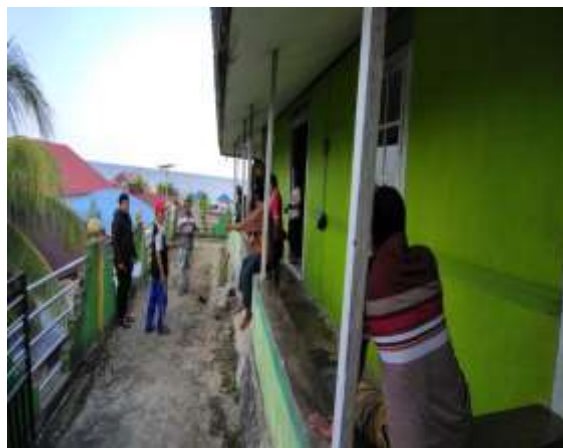
Gambar 2. Diskusi Sama Masyarakat di area masjid

Proses diskusi dalam menentukan gambaran dari rehap masjid