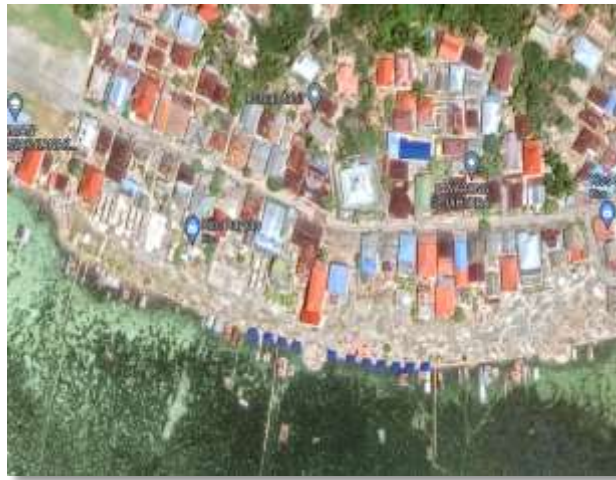
Gambar 1. Lokasi Pengabdian