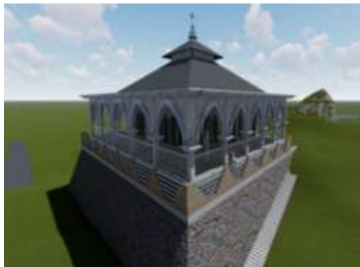
Gambar 5. Model masjid yang di desain