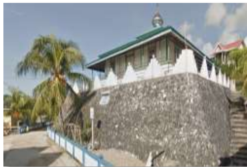
Gambar 4. Model Masjid Kondisi Eksisting

Masjid jabal holimombo memiliki ukuran dengan besar badan masjid 12mx12m dengan teras keluar sebesar 1,3 m dengan disisi sisi masjid dan pada tahap rehap ini yang menjadi bagian dari proses rehap berupa rehap teras, dinding, pintu dan jendela masjid serta plafon adapun yang lain masih dibiarkan pada kondisi eksisting. Dan adapun model jadi dari gambar rehap yaitu sebagai berikut :