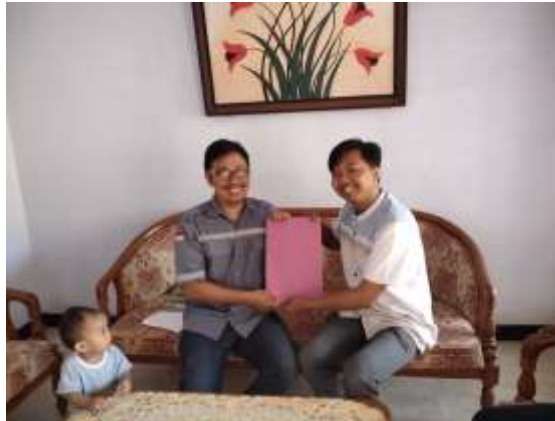
Gambar 6 Penerapan Alat Hidroponik Pada Mitra

Aspek keterlibatan masyarakat dalam pengabdian masyarakat ini memainkan peran penting dalam keberhasilannya secara keseluruhan. Petani lokal dan penduduk desa secara aktif berpartisipasi dalam sesi pelatihan dan lokakarya, memperoleh pengetahuan dan keterampilan penting terkait pertanian cerdas dan hidroponik. Transfer pengetahuan memberdayakan masyarakat untuk mengoperasikan dan memelihara sistem secara mandiri, menumbuhkan rasa kepemilikan dan keberlanjutan. Selain itu, pertemuan rutin masyarakat dan kegiatan berbagi pengetahuan menciptakan platform untuk diskusi terbuka dan pertukaran pengalaman. Hal ini tidak hanya memperkuat ikatan sosial tetapi juga memfasilitasi perbaikan berkelanjutan dari praktik pertanian cerdas yang diterapkan berdasarkan pembelajaran kolektif.