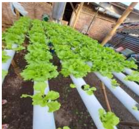
Gambar 2 Kondisi sistem hydroponic yang digunakan mitra

Saat ini cara pengamatan petani dalam melakukan cocok tanam masih melalui pengamatan secara langsung ke lokasi. Selain itu, dalam penggunaan energi pada sistem hydroponic masih menggunakan listrik rumah tangga. Dalam beberapa tahun terakhir pemanfaatan energi listrik menggunakan PV (Photovoltaic) (Abdillah, Afandi, Falah, & Firmansah, 2020; Abdillah et al., 2022; Faiz et al., 2023) mengalami pertumbuhan cukup besar karena mampu mengurangi biaya implementasi dan mengurangi konsumsi listrik rumah tangga (Reis, de Paula, Volpato, Barbosa, & dos Reis, 2022). Berdasarkan hal tersebut tim pengabdian mengembangkan sistem hydroponic pada kelompok mitra yang bermula konvensional dan menggunakan energi listrik rumah tangga, dikembangkan menjadi smart farming menggunakan sistem kontrol arduino dan terintegrasi panel surya sebagai sumber energi mandiri.