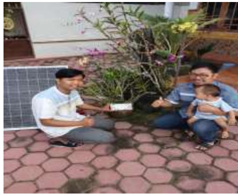
Gambar 4 Penerapan Alat Hidroponik Pada Mitra

Penerapan smart farming berbasis panel surya pada budidaya hidroponik di Dusun Bakalan, Desa Wonodadi, Kecamatan Wonodadi, Kabupaten Blitar membuahkan hasil yang menjanjikan. Kombinasi teknik smart farming dan pemanfaatan energi terbarukan pannel surya menunjukkan peningkatan yang signifikan dalam hasil panen, efisiensi energi, dan keterlibatan masyarakat. Dalam penggunaan smart farming ini menunjukkan 30 persen peningkatan hasil panen dibandingkan dengan metode pertanian konvensional. Peningkatan ini dapat disebabkan oleh pengendalian yang tepat terhadap faktor lingkungan, seperti pemberian nutrisi dan pengelolaan lingkungan suhu kelembapan humidity, yang difasilitasi oleh sistem smart farming. Kondisi pertumbuhan yang optimal berkontribusi pada tanaman yang lebih sehat dan produksi yang lebih tinggi, sehingga memastikan sumber produk segar yang lebih berkelanjutan bagi masyarakat.