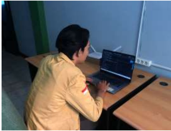
Gambar 1 : Proses perancangan website dengan aplikasi VScode

Penulis telah melakukan survey segmentasi dalam membantu perusahaan untuk meningkatkan income. berikut adalah hasil segmentasi pasar yang sudah dilakukan.