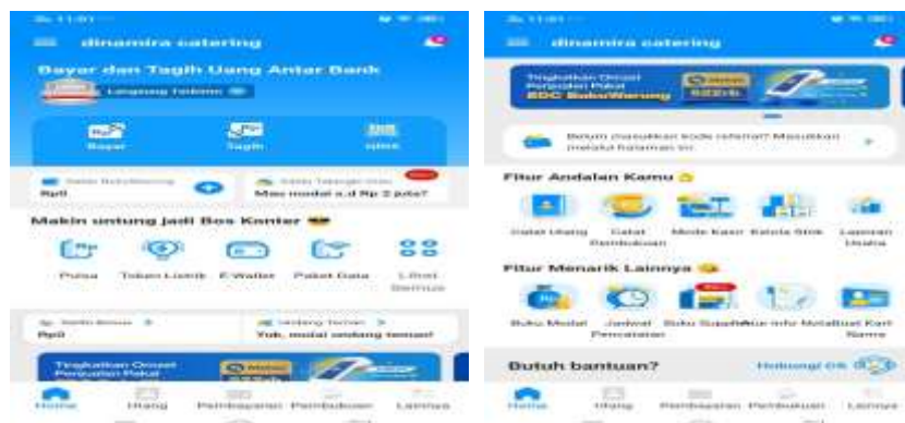
Gambar 1. Aplikasi BukuWarung

Didirikan pada 2019, BukuWarung adalah perusahaan teknologi yang menyediakan infrastruktur digital bagi lebih dari 7 juta pengguna UMKM di Indonesia. BukuWarung diluncurkan oleh Chinmay Chauhan (salah satu tokoh dalam daftar Forbes 30 Under 30 tahun 2021) bersama Abhinay Peddisetty dengan visi lebih dari 65 tahun untuk memberikan kesempatan kepada satu juta UKM Indonesia untuk mentransformasikan diri dalam bentuk Bisnis. aplikasi akuntansi untuk menginformasikan keuangan.