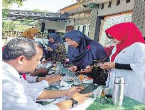
Gambar 3. Pelaksanaan pelatihan dan praktik

metode pembayaran yang memudahkan pelanggan yang tidak memiliki cukup uang tersisa untuk membeli stok di toko atau produk massal, memungkinkan pelanggan membayar sekarang dan membayar nanti. (6) Accounting atau pembukuan adalah fitur yang memudahkan untuk melacak keuangan bisnis, tingkat persediaan, barang yang dijual, dan hutang. tidak perlu khawatir pembukuan manual atau dokumen hilang karena pembukuan bisnis dengan aplikasi BukuWarung mudah, sederhana dan efektif.