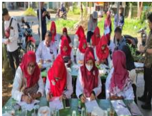
Gambar 2. Pemberian materi

Materi pengetahuan tentang laporan keuangan, laporan laba rugi dan catatan laporan keuangan lainnya disampaikan oleh pemateri. Kegiatan tanya jawab dilakukan bersamaan dengan penyajian materi. Para peserta dapat langsung berdiskusi dengan para pemateri secara langsung untuk memahami materi dan saling berbagi pengalaman terkait dengan masalah yang tengah dibahas dalam materi bersangkutan.