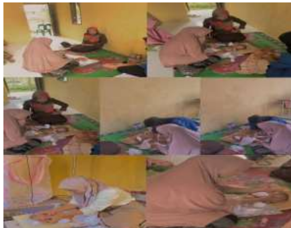
Gambar 3. Sosialisasi dan Implementasi secara langsung serta diskusi

b. Tahap kedua sosialisasi dan pemaparan materi pengabdian tentang Pijat Bayi