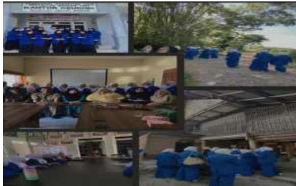
Gambar 2. Pertemuan dengan tokoh masyarakat

a. Tahap pertama yaitu pertemuan dengan tokoh masyarakat dan perangkat desa