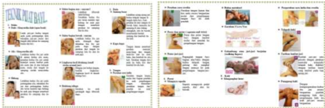
Gambar 4. Leaflet

Hasil pengukuran pengetahuan sasaran sebelum penyuluhan hanya 30% yang mengetahui tentang cara dan langkah-langkah Pijat bayi yang baik dan benar dan setelah diberikan penyuluhan kesehatan menjadi 90% sehingga terjadi peningkatan pengetahuan sebesar 70%.