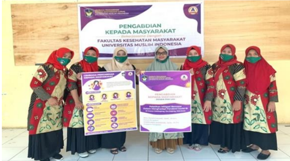
Gambar 4. Foto bersama dengan peserta pelatihan mitigasi bencana covid-19