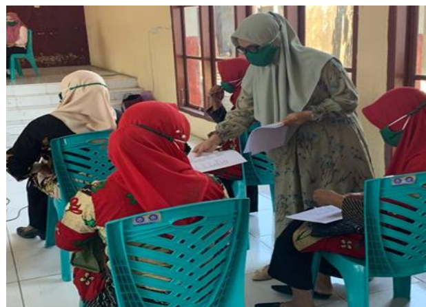
Gambar 3. Pembagian Pretest pada peserta Pelatihan