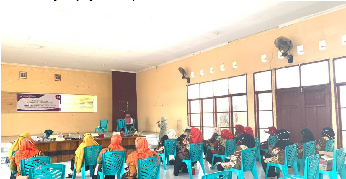
Gambar 2. Penyuluhan materi mitigasi bencana covid-19 di Dusun Kalebajeng

Berikut foto kegiatan pengabdian masyarakat