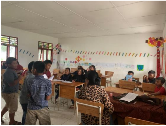
Gambar 3. Proses pembelajaran dalam kelas 6