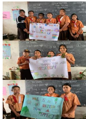
Gambar 6. Keterampilan kelas 6 dalam membuat motto Bahasa Inggris