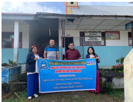
Gambar 2. Pelepasan Mahasiswa di lokasi PKM

Dari kegiatan PkM ini dan dengan program yang telah dijalankan disetiap kelas peserta didik SDN Partibi Lama mendapatkan pembelajaran dalam berbahasa Inggris dan juga mendapatkan pengetahuan cara belajar tahap awal dalam berbahasa Inggris dengan menggunakan kamus. Siswa/i SDN Partibi Lama sangat antusias dan bersemangat untuk mengikuti setiap bimbingan yang sedang berjalan dikelas mereka masing-masing . dan dalam penelitian ini pun dilakukan secara tertulis untuk membuktikan peningkatan pembelajaran siswa/i SDN Partibi Lama. Lalu hasil dari ini diolah dengan menggunakan excel sehingga memperoleh nilai akhir yang dapat dijadikan sebagai hasil dari penelitian ini.