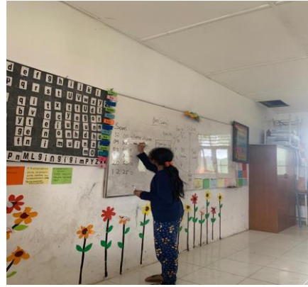
Gambar 4. Proses Pembelajaran di kelas 5