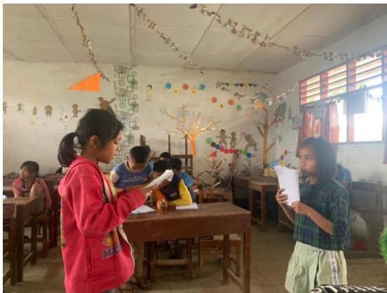
Gambar 5. Proses Pembelajaran di kelas 4