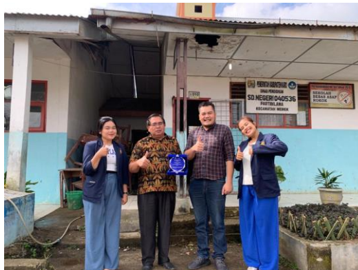
Gambar 7. Proses Penjemputan Mahasiswa dari Lokasi PKM

Dari gambar diatas adalah dokumentasi kegiatan yang dilakukan oleh tim PKM di SDN Partibi Lama. Tim melakukan kursus bahasa inggris untuk memperdalam pengetahuan berbahasa inggris dalam hal berbicara, mendengar, membaca, dan menulis. Keempat skill tersebut sangat penting sebagai landasan mahir berbahasa inggris.