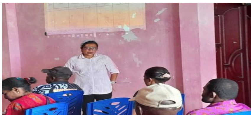
Gambar 3. Diskusi dengan Aparatur Kampung

Pelaksanaan kegiatan yang dilaksanakan selama 2 (dua) hari berlangsung dengan baik mulai dari tahap awal, inti hingga tahap akhir. Dalam kegiatan penyampaian materi mengenai administrasi pemerintahan desa diikuti oleh kepala kampung dan aparat Kampung Yakonde Distrik Waibu Kabupaten Jayapura. Dimana dalam pelaksanaannya diikuti oleh para peserta dengan antusias. Mereka berharap dengan adanya kegiatan ini, maka kedepannya dengan dukungan administrasi kampung yang benar akan menciptakan penyelenggaraan pemerintahan kampung yang lebih baik. Sebagaimana Alrasyid et al. (2021) mengatakan bahwa agar dapat menciptakan pemerintahan desa (kampung) yang baik, maka pemerintahan desa musti didukung pula sistem administrasi desa yang benar.