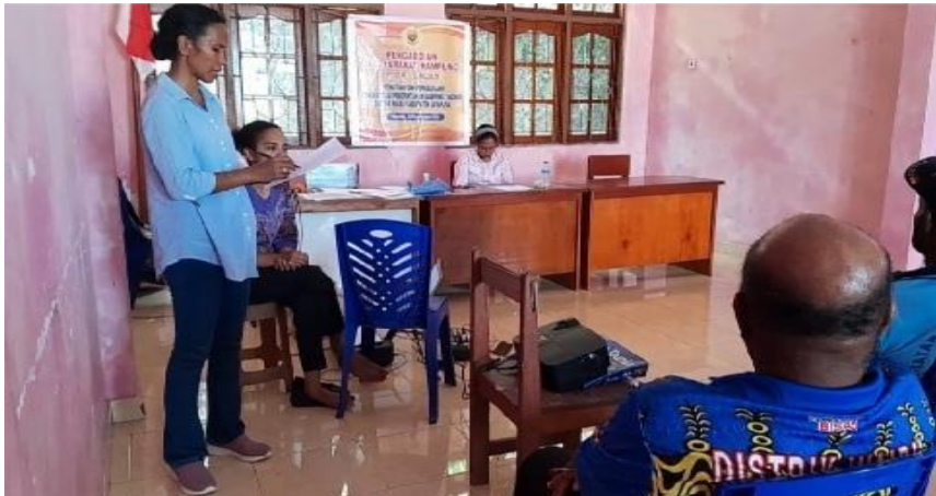
Gambar 2. Penyampaian Materi Administrasi Pemerintahan Kampung

yang terdiri dari: Buku Administrasi Umum, Buku Administrasi Penduduk, Buku Administrasi Keuangan dan Buku Administrasi Pembangunan. Adapun hasil yang didapat adalah aparat Kampung Yakonde Distrik Waibu Kabupaten Jayapura dapat memahami dan mengerti tentang administrasi pemerintahan desa sebagaimana yang tertuang dalam Peraturan Menteri Dalam Negeri Nomor 47 Tahun 2016 Tentang Administrasi Pemerintahan Desa. Selanjutnya, pada tahap akhir kegiatan dilakukan penyerahan Buku Administrasi Pemerintahan Kampung yang diterima langsung oleh kepada Kepala Kampung Yakonde didampingi oleh aparat kampung. Buku Administrasi Pemerintahan Desa yang diserahkan berupa 14 buku administrasi umum dan administrasi penduduk.