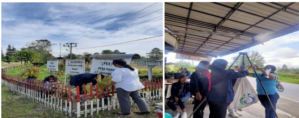
Gambar 5. Kebersihan ditaman kantor kepala desa dan Kegiatan mahasiswa di posyandu

Dari gambar diatas adalah dokumentasi kegiatan yang dilakukan oleh tim PkM di DESA SIARO. Tim melakukan les tambahan di desa siaro untuk memperdalam berbahasa Inggris, berhitung dan membaca. Tim juga melakukan kebersihan lingkungan di desa siaro bersama perangkat desa , mahasiswa membantu bidan desa dalam melaksanakan posyandu ,untuk memeriksa kesehatan bayi,balita dan ibu hamil.