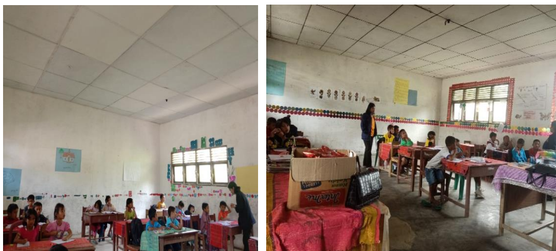
Gambar 1. Kegiatan les disekolah berlangsung

Dari kegiatan PkM ini dan dengan program yang telah dijalankan dari kelas 1-5 di desa siaro mendapatkan pembelajaran dalam berbahasa Inggris dan juga mendapatkan pengetahuan belajar menghitung dan membaca. Siswa yang ada di desa siaro sangat antusias dan bersemangat untuk mengikuti setiap bimbingan yang sedang berjalan di kelas mereka masing-masing. Dan dalam penelitian ini pun dilakukan secara tertulis untuk membuktikan peningkatan pembelajaran siswa di desa siaro dengan mengadakan les tambahan.