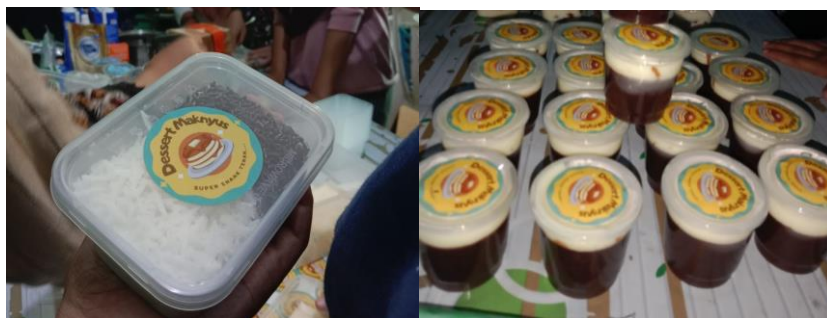
Gambar 9 Hasil Produk Dessert