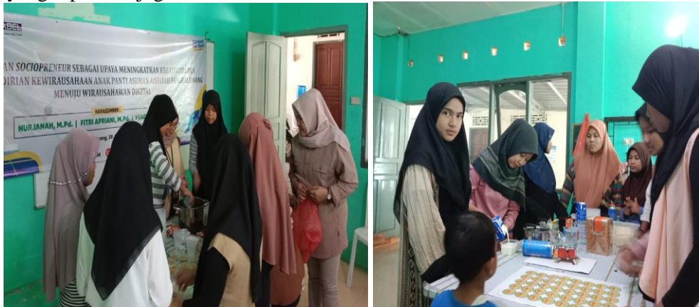
Gambar 5 Pendampingan Pembuatan Produk Dessert

Sejalan dengan jiwa kewirausahawan yang mampu untuk menciptakan sesuatu yang baru dan berbeda melalui kreativitas serta kemandirian dalam menciptkana peluang dan menghadapi tantangan hidup di era milenial. Seorang wurausha perlu menumbuhkan jiwa kemandiran anak-anak panti asuhan aisiyiah. Pelaksana kegiatan tahap keterampilan produk dilakukan oleh peserta dan didampingi narasumber dan mahasiswa yang mendampingi. Pada pelatihan ini keterampilan yang dijadikan dasar dalam membuat produk makanan dessert box tentunya dibutuhkan kreativitas yang tinggi. Sebanyak 25 anak panti asuhan memperhatikan ketika penyampaian materi dan melakukan Tanya jawab dengan antusias. Pemateri yang melakukan praktik pembuatan deserrt yaitu pembuatan dessert setup roti tawar, dan pudding cokelat dengan topping fla. Setiap arahan dari pemateri dilaksanakan dengan baik sehingga hasil yang diperoleh juga baik.