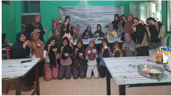
Gambar 3 Kegiatan Penyuluhan dan Motivasi Kewirausahaan

Kegiatan ini bertujuan sebagai dasar pemahaman untuk membuka wawasan anak Panti Asuhan Aisiyah Pangkalpinang terkait kewirausahaan.