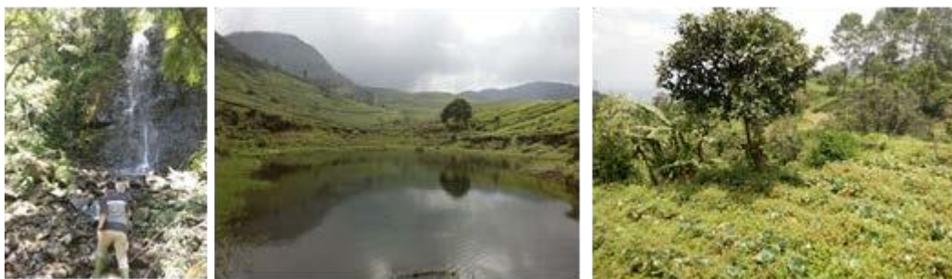
Gambar 5. Kondisi daya tarik wisata Curug Sawyer, Danau Benteur, Kebun sayur

Secara umum kondisi daya tarik wisata khususnya masih alami. Curug dan danau kondisinya masih bersih, banyak tumbuhan alami, dan terdapat ikan. Namun, kondisi akses menuju lokasi masih sulit. Proses penilaian kelayakan daya tarik kepada tokoh masyarakat pada proses wawancara, pembuatan peta partisipatif, dan observasi lapangan. Pada tahap ini, responden diminta menilai dari questionnaire yang diberikan dalam bentuk form aspek serta kriteria daya tarik wisata. Proses penilaian ini didampingi oleh fasilitator.