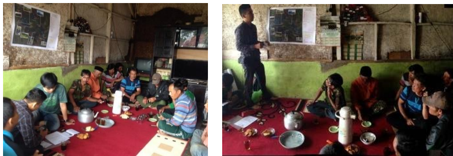
Gambar 6. Proses FGD di Desa Tugu Utara

Kebun Kopi dan Wisata Curug Sawer dapat memberikan kesejahteraan di Desa Tugu Utara. Produk kopi tersebut menghasilkan kopi dengan kualitas terbaik dan mendapatkan kejuaraan kopi tingkat nasional. Telah terdapat sistem tumpang sari kopi dan sayuran yang telah dilaksanakan masyarakat, hal ini dapat memberikan manfaat ekonomi untuk kesejahteraan masyarakat. Potensi lainnya adalah rumput gajah yang ditanam masyarakat, dibudidayakan dan dijual ke Kebun Binatang (Taman) Safari Indonesia untuk pakan hewan. Berdasarkan hasil wawancara pula, pada skala desa, di beberapa area di Desa Tugu Utara, terdapat rute downhill untuk pesepeda. Kegiatan ini menjadi atraksi tersendiri bagi penggemar downhill dan dapat menjadi daya tarik wisata.