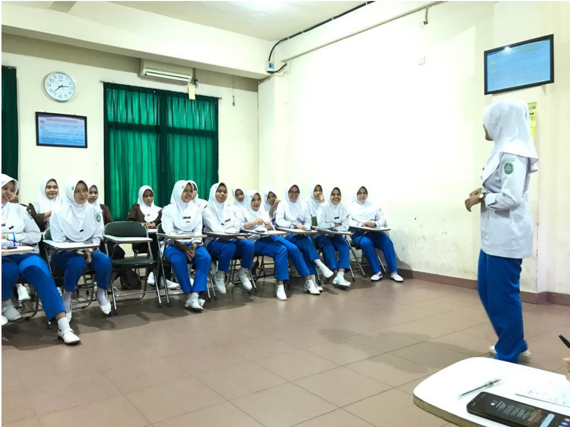
Gambar 2. Pelaksanaan Kegiatan Pengabdian Kepada Masyarakat

dapat memotivasi pelajar yang tidak terlibat dalam berbicara, dan pendekatan ini dapat membuat mereka lebih memperhatikan teman sekelas dan gurunya.