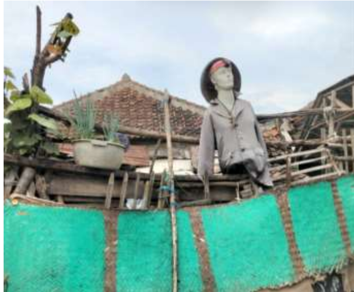
Gambar 4. Area Parkir Kelompok Tani Saluyu

Sementara dalam hal Penyusunan Perencanaan Keuangan umumnya merasa tidak perlu karena terbiasa mengelola keuangan dengan basis harian. Pendapatan yang diperoleh pihak suami dan istri sebagai buruh tani, biasanya polanya harian. Kondisi ini memerlukan perhatian dari akademisi, praktisi, dan profesional untuk memberikan penyuluhan sebagai antisipasi jika warga mendapatkan uang dalam jumlah banyak agar sudah mengetahui seperti apa alokasi prioritas pengelolaan yang baik untuk masa depan keluarganya.