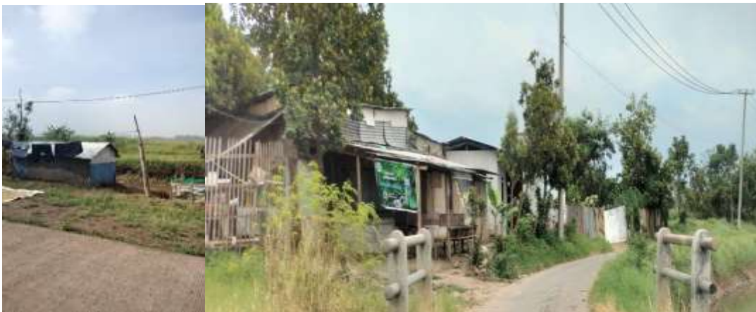
Gambar 5. Kondisi desa

Berdasarkan kondisi tersebut, tim peneliti bersama dengan praktisi dari komunitas Women In Finance , dan perwakilan agen Branchless Banking akan bersama menyelenggarakan penyuluhan literasi keuangan. Target jangka pendek dari penyuluhan tersebut adalah menstimulus warga, terutama para ibu yang umumnya memegang pengelolaan keuangan keluarga untuk tidak hanya mengelola keuangan berdasarkan basis harian dan tidak takut lagi menggunakan layanan keuangan formal.