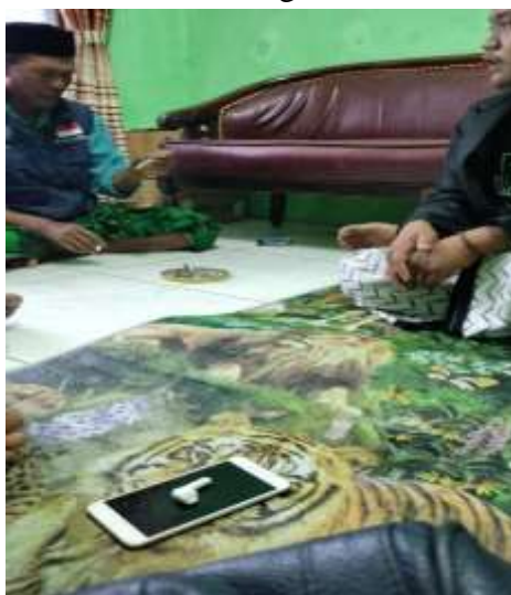
Gambar 3. Langkah-langkah yang dilakukan dalam melakukan Analisis

Berdasarkan wawancara yang dilakukan dengan perwakilan dari Komunitas Petani Saluyu, faktor-faktor yang menyebabkan warga tidak pernah menggunakan layanan Lembaga keuangan formal antara lain karena lokasi bank yang jauh dari pemukiman warga, Kekhawatiran dengan kompleksitas urusan administrasi, dan melihat kebiasaan tetangga dalam mengelola keuangan. Meskipun ada agen Branchless Banking di dekat Gelora Bandung Lautan Api (GBLA), masyarakat lebih memilih menyimpan kelebihan dana yang dimiliki pada Bendahara Madrasah atau mengikuti arisan.